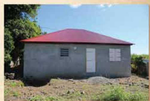
Version prêt à habiter de 54 250€ TTC